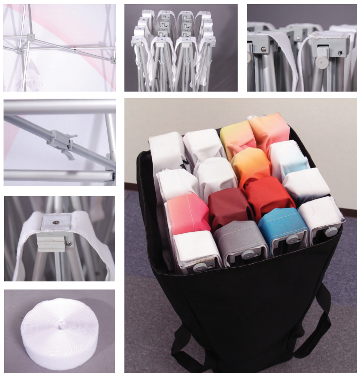
【ナイロンキャリーバッグ(付属)】

また、マジックテープ式のディスプレイのため、設置及び撤収が簡単。イベントや展示会、ショールームなどさまざまな場所での利用に適しています。